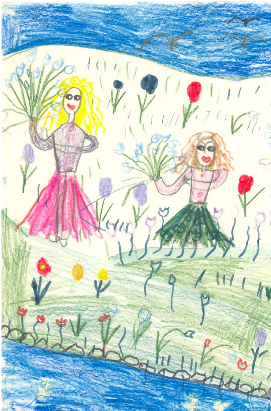
Szócs Emese (8 éves, Gyergyócsomafalva, Románia) rajza